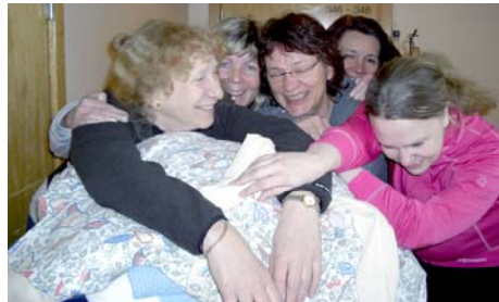
Teamet ved Psykiatrisk senter ved UNN vil la brukerne kunne innlegge seg selv.

tror er et godt tilbud kan oppleves som krenkende av noen. Teamet har også opplevd at det for enkelte kolleger kan være vanskelig å gi fra seg vurderingen av pasientens tilstand/ behov. Dette blir nok noe av utfordringen i prosjektet – at makten skifter eier!